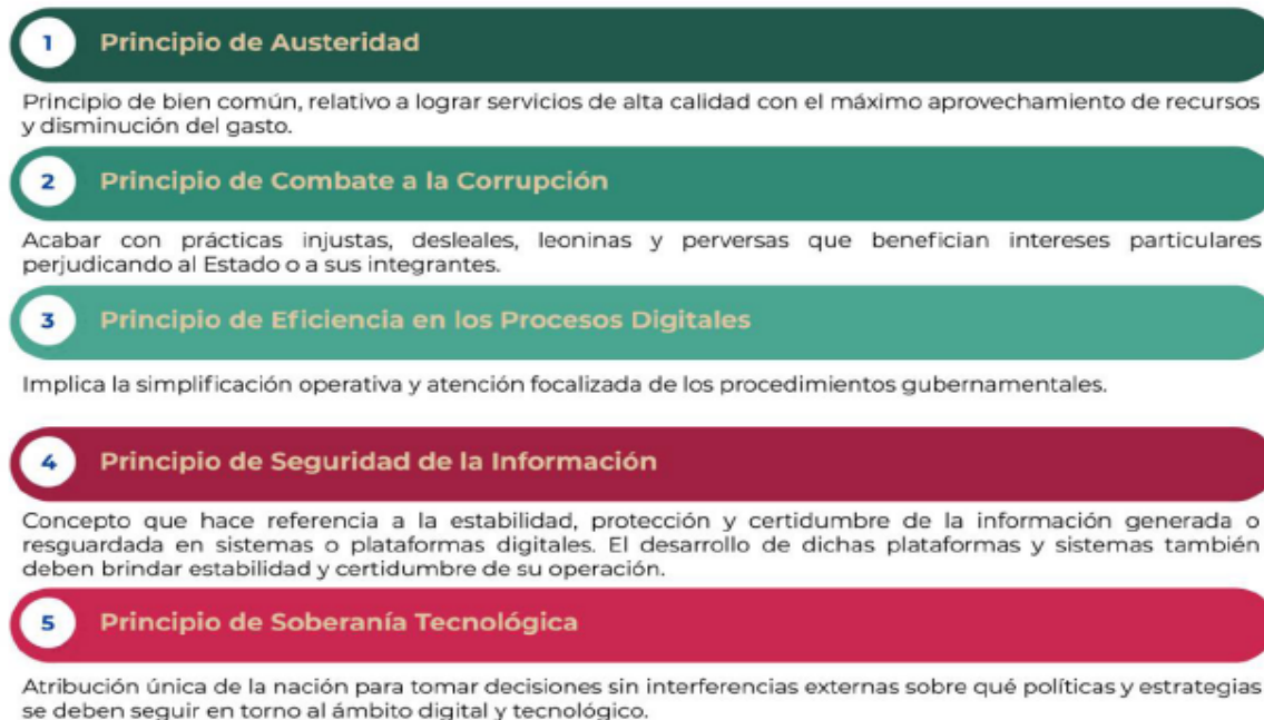
Figura 1. Principios de la EDN

La EDN aterriza las capacidades gubernamentales en la prioridad de atender los planteamientos de una adecuada gobernanza tecnológica, la mejora de los servicios digitales y la optimización de los procesos, enmarcando dichos propósitos en los siguientes principios: