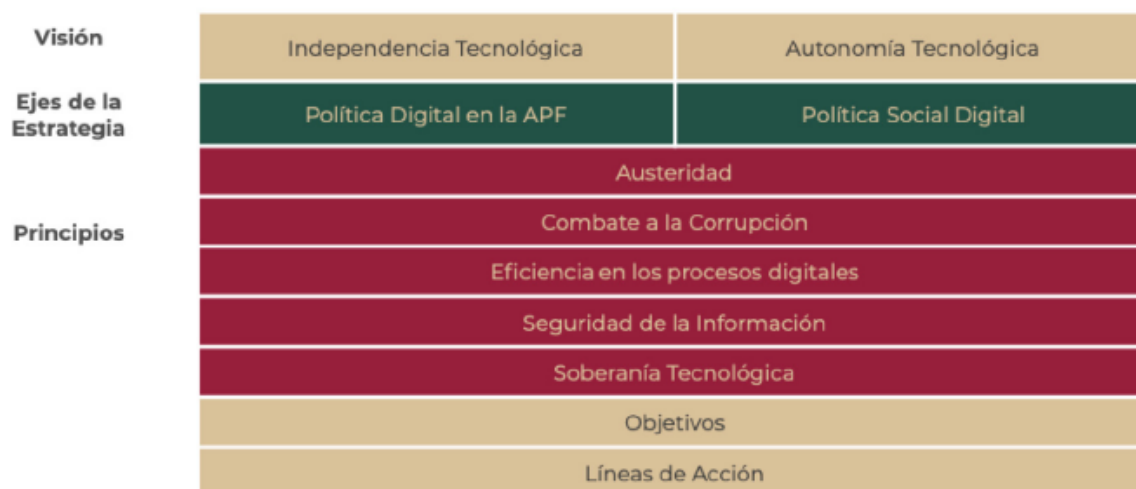
Figura 3. Marco estructural de la EDN

Los dos objetivos generales de la estrategia se componen de nueve objetivos específicos y líneas de acción identificadas como relevantes en materia de tecnologías, gobierno digital, conectividad, inclusión digital, software libre ii , estándares abiertos, digitalización de trámites, sistemas e infraestructura interoperables y seguridad de la información, que orientan el quehacer de las dependencias y entidades para dar sentido, unicidad y congruencia a esta Estrategia, cuya finalidad es una transformación centrada en las y los ciudadanos.